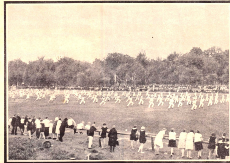
Eigene Platzanlage des M. T. V., verlängerte Schmidstraße