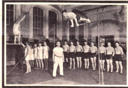
Männer- und Jugendabteilung

Daneben wird besonders ausgeprägt die Betätigung in allen Ballspielarten sowie im Volksturnen auf grünem Rasen durchgeführt.